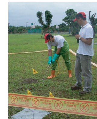
使用觸殺型藥劑灌注蟻丘