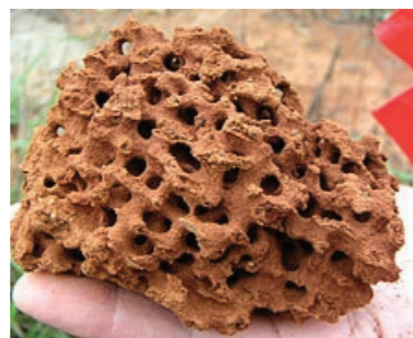
蟻巢內之蜂巢狀結構