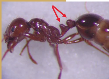
火蟻所屬之家蟻亞科