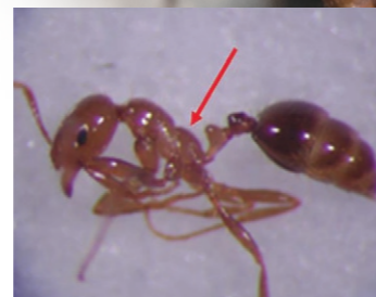
火蟻屬無前伸腹節齒