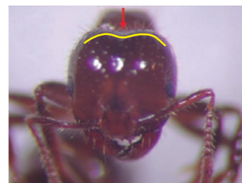
入侵紅火蟻後頭部平順無凹陷