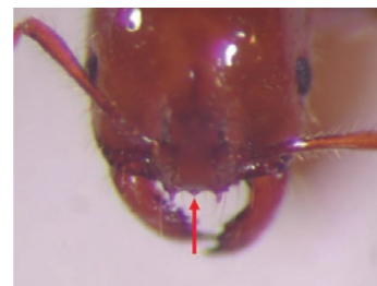
入侵紅火蟻有明顯頭楯中齒