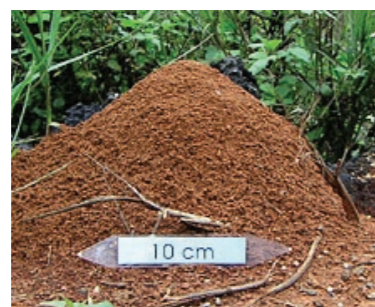
入侵紅火蟻成熟蟻巢

明顯隆起的蟻丘是最容易辨別入侵紅火蟻的方法，因為台灣約 270 種螞蟻中，沒有會築出高於地面 10 公分蟻丘的種類，蟻丘內部呈蜂巢狀結構，但需注意蟻巢初形成時並無明顯之蟻丘，易與其它種類螞蟻之蟻巢混淆。