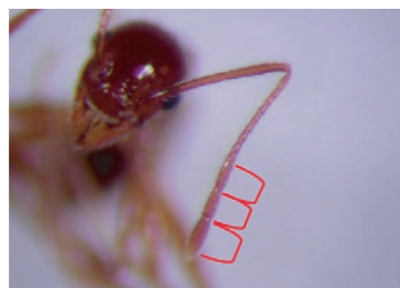
大頭家蟻屬錘節 3 節