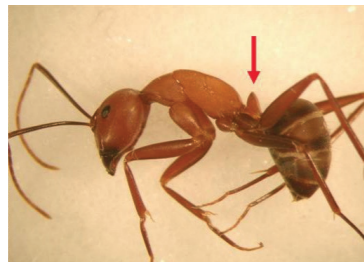
非火蟻之其它亞科螞蟻