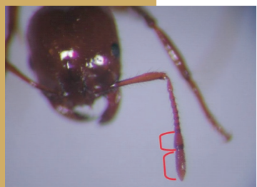
火蟻屬錘節 2 節