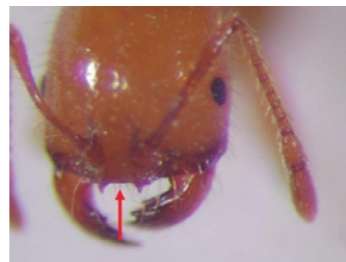
熱帶火蟻無頭楯中齒