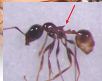
擬大頭家蟻屬有前伸腹節齒