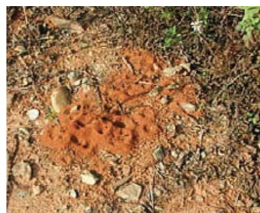
入侵紅火蟻初期蟻巢無明顯隆起